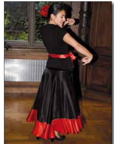
Künstlerinnen aus aller Welt

Der Frauenausschuss des MIB der Stadt Bamberg unterstützt die Frauen in diesem Prozess. Im vergangenen Jahr 2010 hat der Ausschuss deshalb ver-