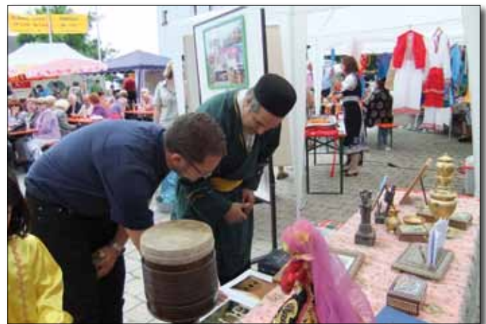
Bild 2 u. 3: Kunsthandwerk aus aller Welt