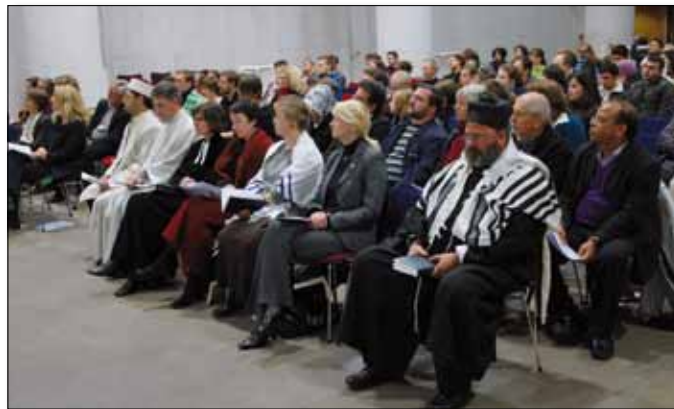
Teilnehmer an der multireligiösen Feier

Neben der guten Zusammenarbeit mit Vertretern der Weltreligionen wurde insbesondere der Austausch mit der Evangelischen