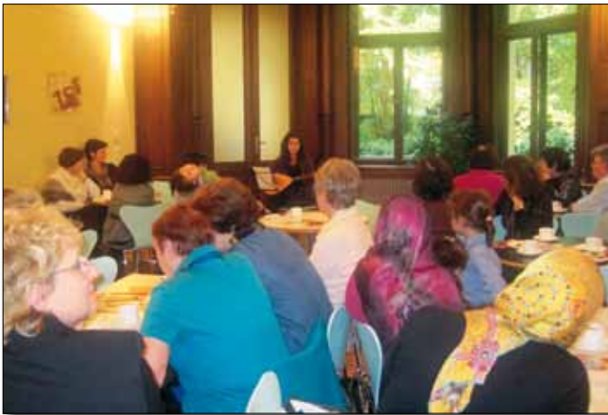
Gemeinsamer Musikgenuss beim Frauentag

schiedene Veranstaltungen durchgeführt, bei denen sich Frauen aus Bamberg mit und ohne deutschen Pass gegenseitig kennenlernen konnten und in gemeinsamen Gesprächen über ihre Probleme und alltäglichen Bedürfnisse reden konnten. Die durchgeführten Maßnahmen bauten eine Brücke zwischen den vielfältigen Kulturen auf und stärkten den interreligiösen Dialog.