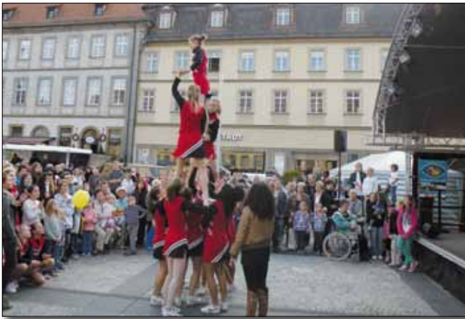
Cheerleading-Verein Lucky Bears