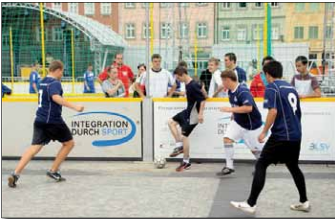
Spaß und Fairplay beim Streetsoccer-Cup 2010 am Maxplatz

strichen werden, dass bei diesem Turnier nicht der Erfolg, sondern der Fairplay-Gedanke absolut im Mittelpunkt steht. Aus demselben Grund wurde auch ein gesondert ausgelobter Fairness-Pokal vergeben.