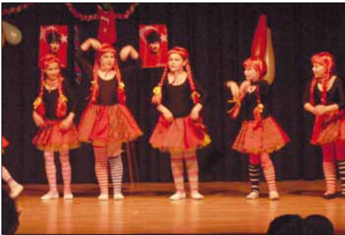
Arbeitsausschuss „Soziales“: Kinderfest