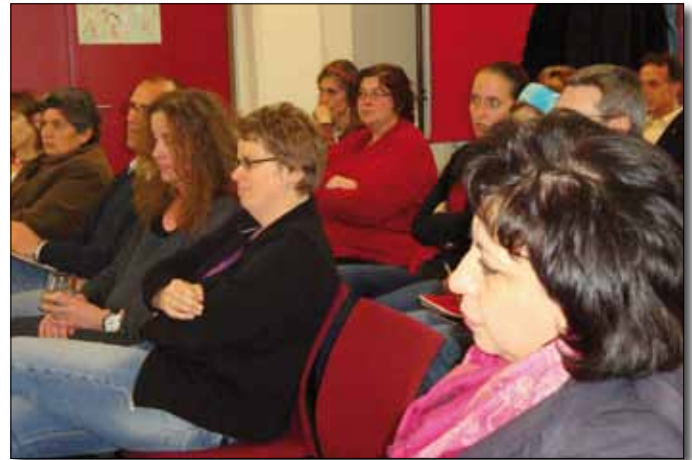
Infoveranstaltung zum Thema „Hartz IV“