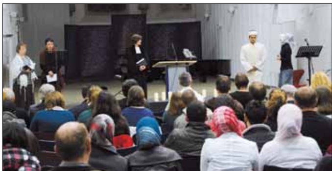
Vertreter/-innen der drei großen Weltreligionen bei der multireligiösen Feier

Seit jeher unterstützt der MIB den Interreligiösen Dialog in Bamberg. Dies geschieht auf vielfältige Weise. So fand auch im Jahre 2010 im Rahmen der Interkulturellen Wochen die bereits zur Tradition gewordene Multireligiöse Feier zum Beginn des Wintersemesters statt. In jüdischen, christlichen und muslimischen Beiträgen kam die religiöse Vielfalt zum Ausdruck, die die Stadt und ihre Universität prägen. Anhand der Glaubensgestalt Abraham wurden