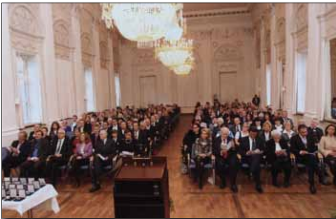
Auditorium bei der Verleihung der Staatsmedaille im Max-Joseph-Saal der Münchner Residenz