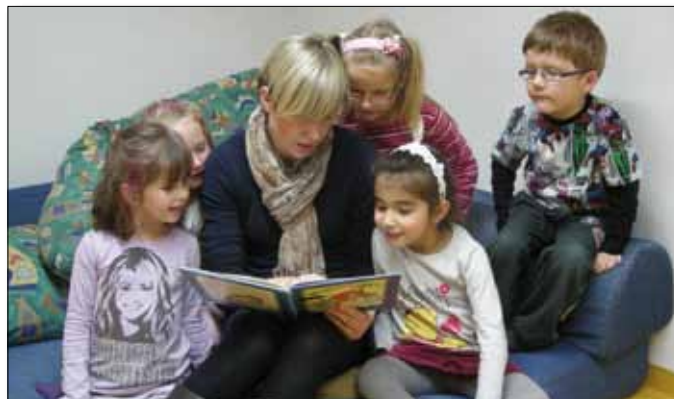
Bamberger Lesefreunde in Aktion

Das Projekt wurde vernetzt und bei vielen Gremien vorgestellt. Es bekam stets positive Rückmeldungen. Da die Nachfrage der Einrichtungen zugenommen hat, wird im Februar 2011 eine neue Schulung für ehrenamtliche Vorleserinnen und Vorleser angeboten. Das Projekt stößt zunehmend auch außerhalb Bambergs auf Interesse. Im Januar 2011 werden es 15 Kindergärten in Bamberg und jeweils ein Kindergarten in Bischberg, Strullendorf und Altendorf sein, in