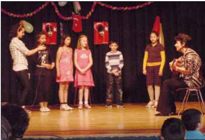
Arbeitsausschuss „Soziales“: Kinderfest