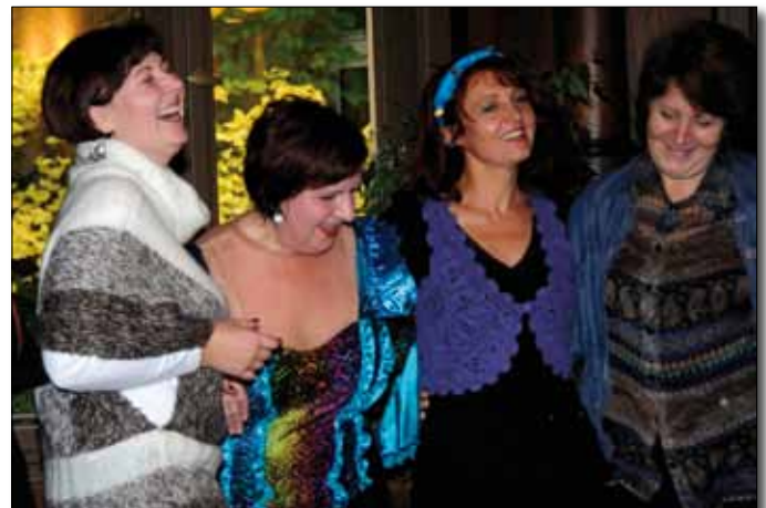
Künstlerinnen aus aller Welt