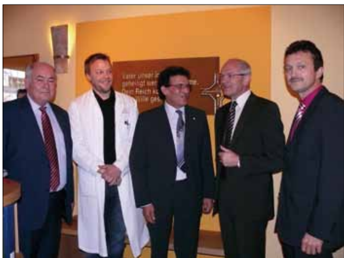
Eröffnung des Raumes der Stille im Christine Denzler-Labisch-Haus