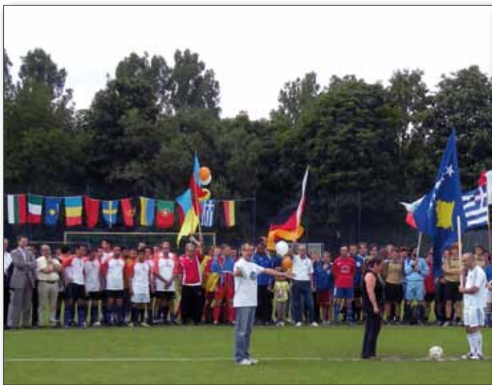
Die interkulturellen Mannschaften beim Anstoß des 10. Internationalen Fußballturniers mit Familienfest

aus der Messe resultierten, war ein sehr erfreulicher Teilerfolg die Etablierung des Nürnberger Leuchtturmprojekts „LeseFreunde durch LeseFreunde“ in Bamberg. Durch den Einsatz von Ehrenamtlichen gemäß der Methode „Dialogisches Lesen“ wird die Sprachförderung in den Bamberger Kindertagesstätten unterstützt. In Bamberg ist das Projekt auf größtes Interesse gestoßen.