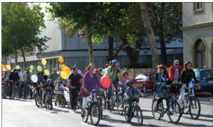
Teilnehmerinnen und Teilnehmer des „Radeln gegen Rassismus“