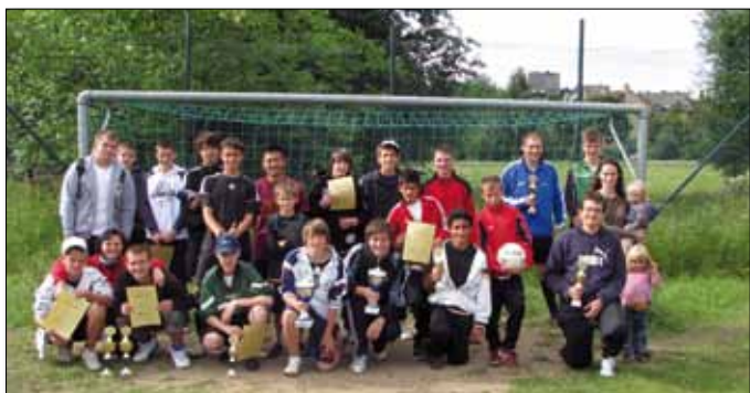
Die Sieger des Streetsoccer-Cup 2009