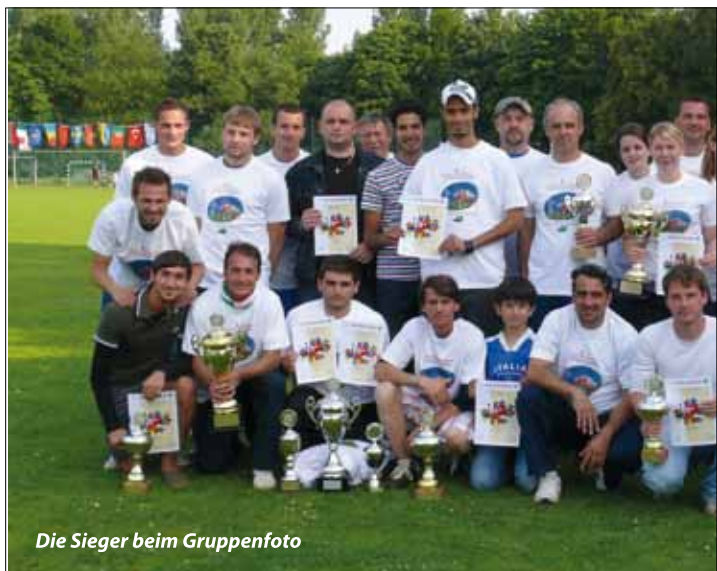
Die Sieger beim Gruppenfoto

Jugend sowie das internationale Damenteam der Otto-Friedrich-Universität Bamberg und das Damenteam der TSG 05) friedlich um den Turniersieg. Diesen holten sich die Italiener: Der FC Italia Azzurri, der übrigens bereits seit 1995 an dem Turnier teilnimmt, besiegte in einem spannenden Finalspiel die Mannschaft des FC Kosova. Den dritten Platz belegte die Türkei, die im Halbfinale in einem spannenden Elfmeterschießen scheiterte.