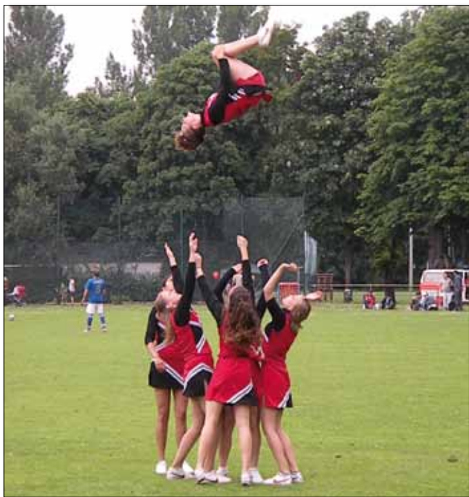
Chearleading mit den Tänzerinnen von „Lucky Bears“ e.V.

ihrem Engagement für Integration eine Durchführung des Turniers in der erreichten Qualität ermöglichen: Sparkasse Bamberg, STWB Stadtwerke Bamberg GmbH, AOK - Die Gesundheitskasse, Dr. R. Pflieger GmbH, Ristorante da Francesco, Da Ciccio - Italienisch genießen, TSG 05 Sportgaststätte Fam. Dimitrakopoulos Triandafilos – Griechische Spezialitäten, Brauerei Keesmann.