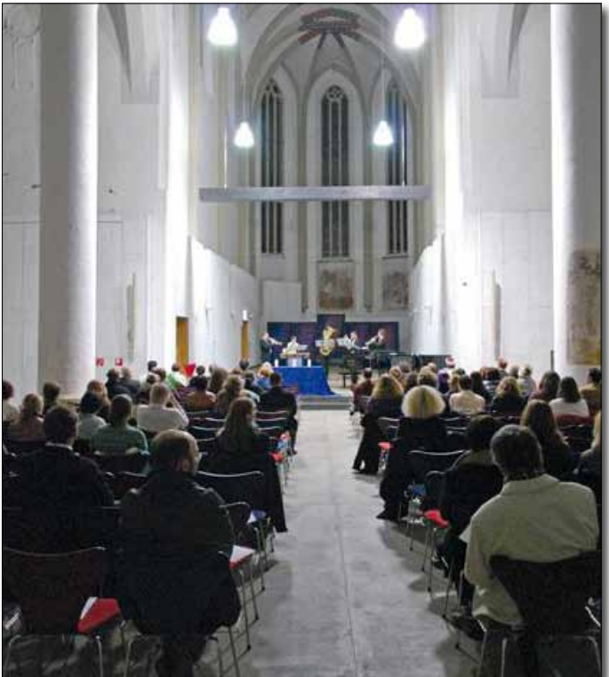
Interreligiöse Feier zur Semestereröffnung in der Aula der Universität

Auch im Jahr 2009 unterstützte der Beirat den interreligiösen Austausch bei verschiedenen Anlässen, so z.B. im Rahmen der Feierlich-