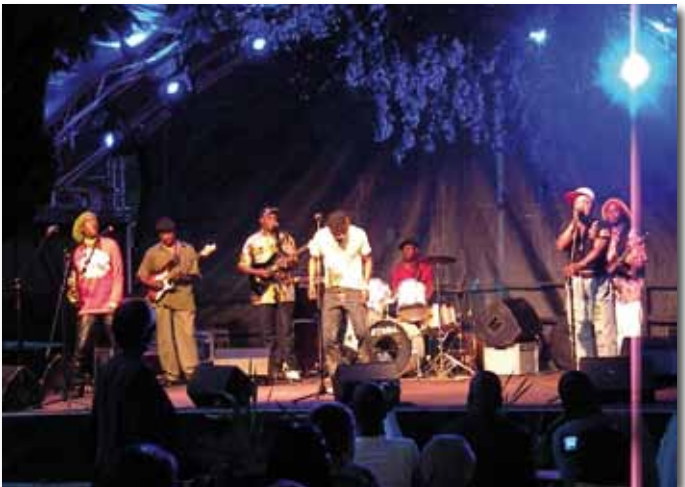
Begeistern die Zuschauer: Die „African Beat Stars“ . . .

Insgesamt kämpften 18 Mannschaften aus zwölf Ländern (zwölf Herrenmannschaften, vier Jugendmannschaften der C- und A-