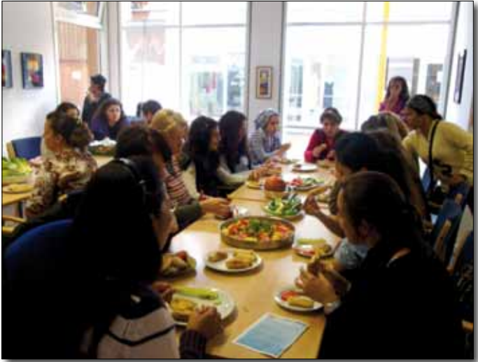
Interkultureller Koch- und Begegnungsabend

und Essen der türkischen Gerichte viel Wissenswertes über das Leben in den verschiedenen Herkunftsländern erfahren. Sie haben ihre Lieblingsrezepte mitgebracht und gerne ihr Kochwissen ausgetauscht. Die Küche und das Kochen wurden auf diese Weise für