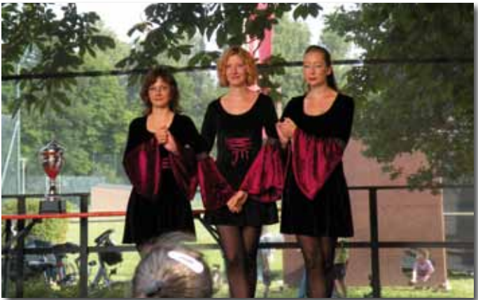
Irischer Steptanz mit „Irish Heartbeat“