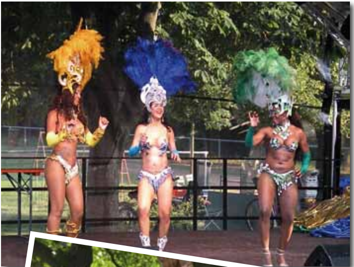
Samba mit der Gruppe „100% Brasil“